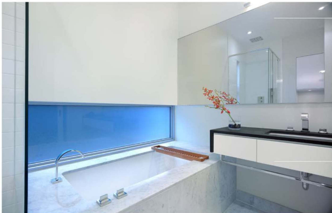
简约优雅的浴室 The bathroom is simple and elegant.